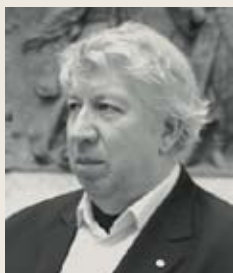
О.С. Романов, президент Союза архитекторов СПб, член Всемирного Клуба петербуржцев

1 марта в Доме архитектора состоялось совместное заседание Всемирного клуба петербуржцев и Общественного экспертного совета города-спутника «Южный».