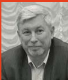
В.Н. Логвинов, вице-президент Союза архитекторов России