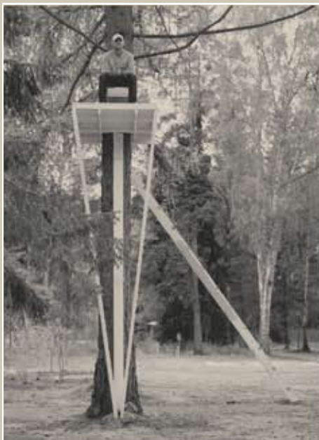
↑ Инсталляция «Люди в кубе»