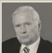
Ю.И. Курбатов, доктор архитектуры, профессор, член-корреспон- дент РААСН и МААМ

■ Относительно недавно на международном семинаре, посвященном новой архитектуре в историческом центре Северной столицы, своим опытом делились известные и успешные петербургские архитекторы. Один из них в процессе дискуссии с неоспоримой убежденностью произнес (цитирую почти дословно): «Для меня архитекторы делятся на тех, кто рисует, и тех, кто болтает!» На это искреннее высказывание невозможно было не обратить внимание. Вполне возможно, что эти слова – плод принципиальной нелюбви к прессе. Но есть ведь и иная, настоящая литература об архитектуре, и ее тоже нужно читать, а не просто смотреть картинки. А может быть, подобный негатив – рецидив «звездной болезни»?